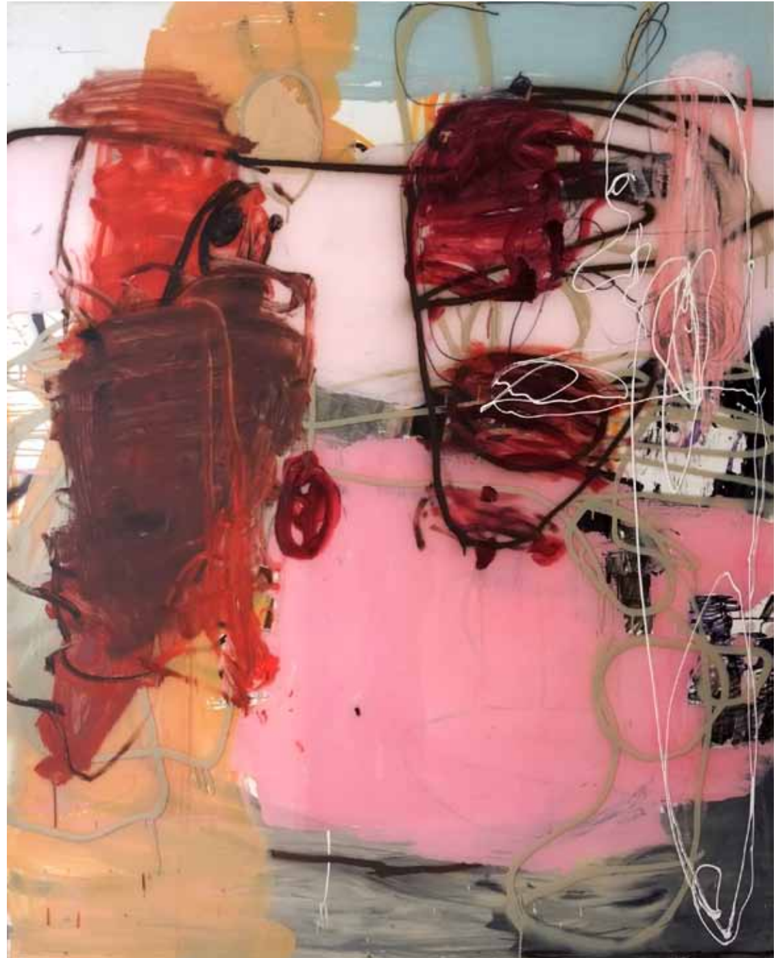
Present of a good friend - Plexi on Wood, 300 x 120 cm

By showing a voluminous, large-scale 5-piece installation of a boudoir, Skovgaard questions the typical classification of masculine and feminine. He mixes the parts of guest and hostess.