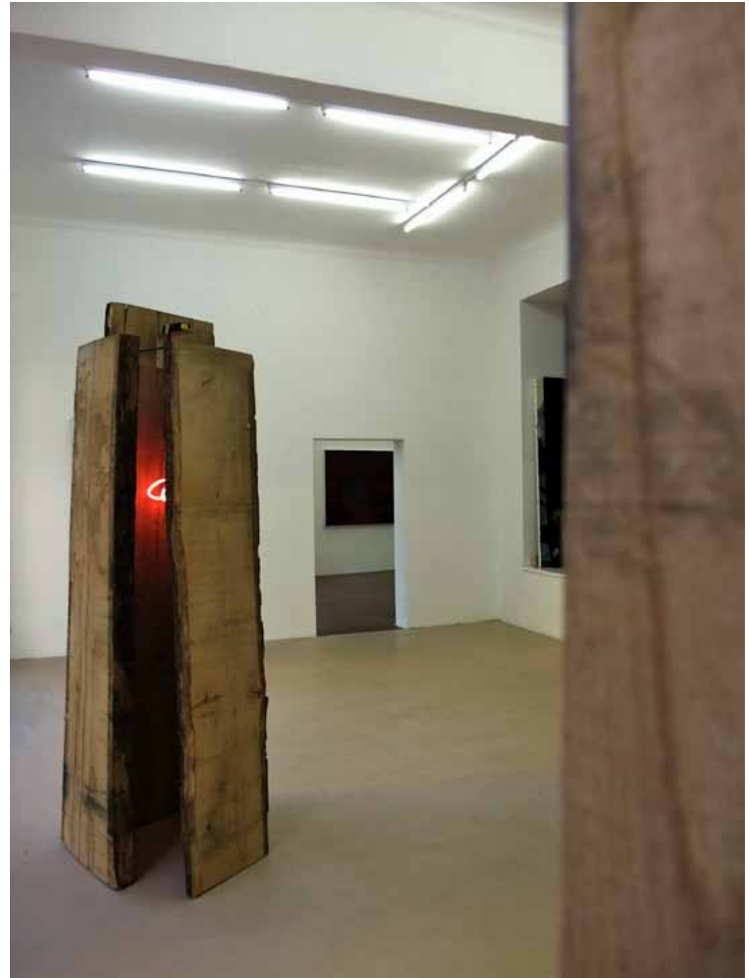
Mirror Cabinet - Oak and Neon, 2009

Welcome to the Boudoir of The Inbetween Balance. Uwe Goldenstein