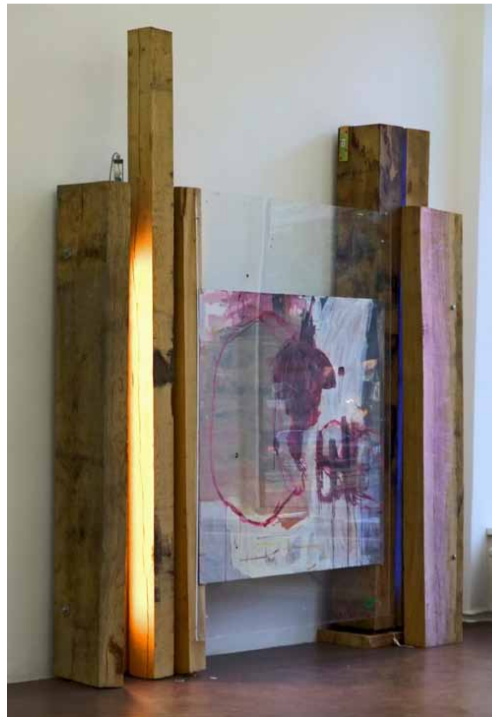
Necessary equipment Plexi, Neon, Oak, Painting on Aluminium