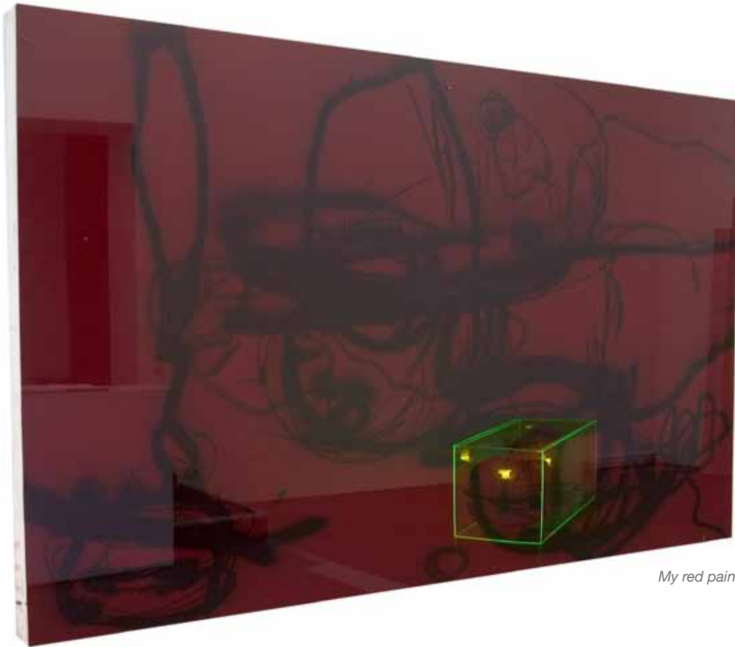
My red painting - Wood and Plexi, 2009

The imagination to be in a boudoir neutralizes the existing borders and the visitor becomes the host at the same time. According to that, the visitor can let his projections wander, may they be of a „feminine“ playfulness or distant masculinity „masculine“ detachment.