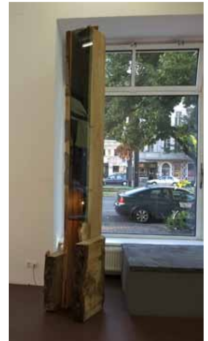
Lamp - Oak, Plexi and small Neon, 2009