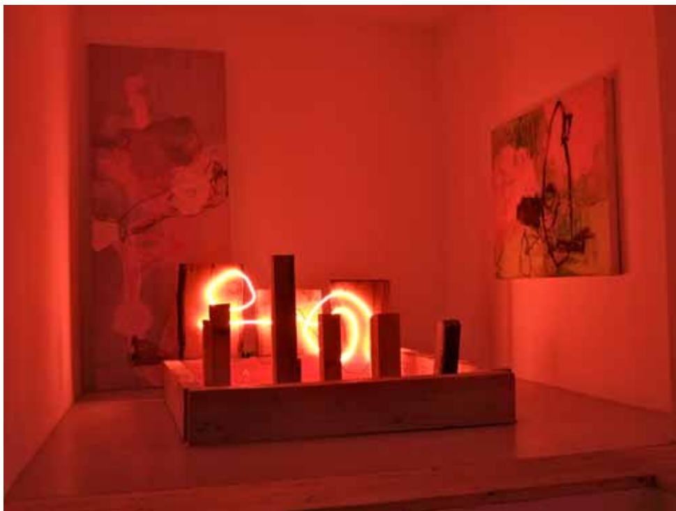
Bed - night view