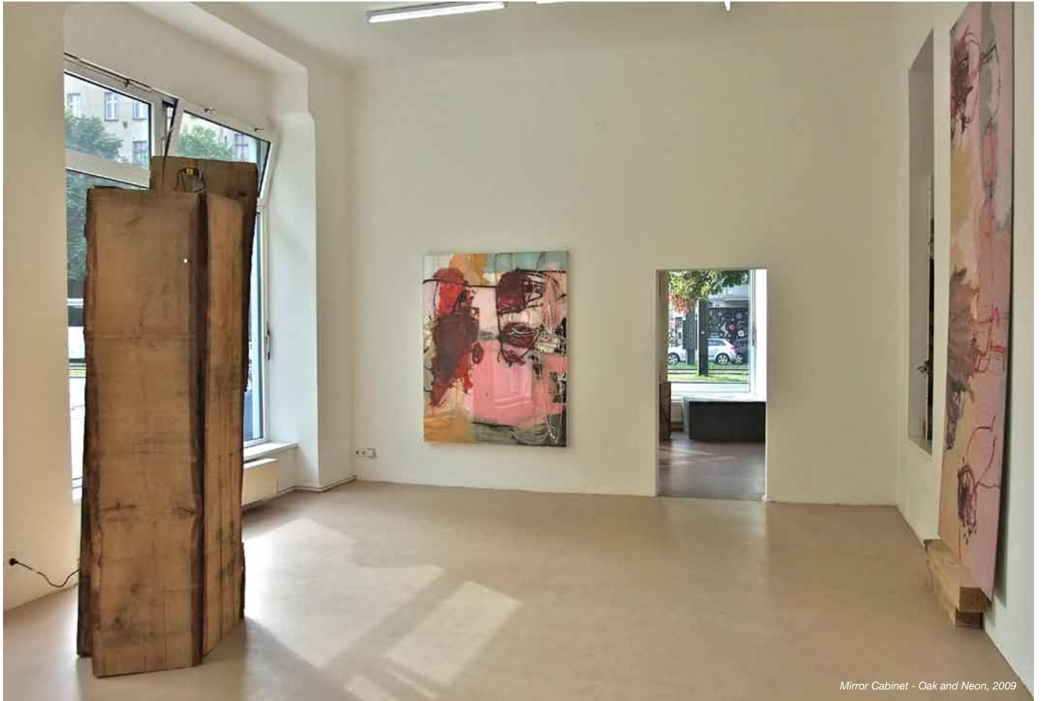
Mirror Cabinet - Oak and Neon, 2009