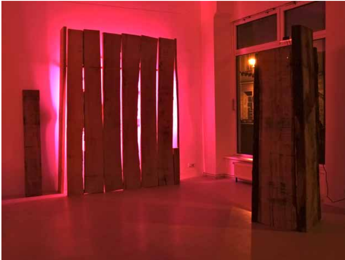
Installation - night view

Skovgaards dynamisch pointierte Malerei setzt sich auf diese Weise in seiner Installation räumlich fort. Das Ergebnis ist eine wohl kalkulierte Mischung aus Spontaneität und Mystik. Denn die Vorstellung, sich innerhalb eines artifiziellen Bordells zu befinden, hebt vorgefertigte Grenzen auf und der Besucher wird gleichzeitig zum Gastgeber, indem er seine Projektionen, seien sie „feminin“ verspielt oder „männlich“ distanzierter Natur, freien Lauf lassen kann. Die leicht verruchte Stimmung des Bordells erhält durch Skovgaards Arbeit eine positive, versöhnliche und gleichzeitig spannungsgeladene Offenheit.