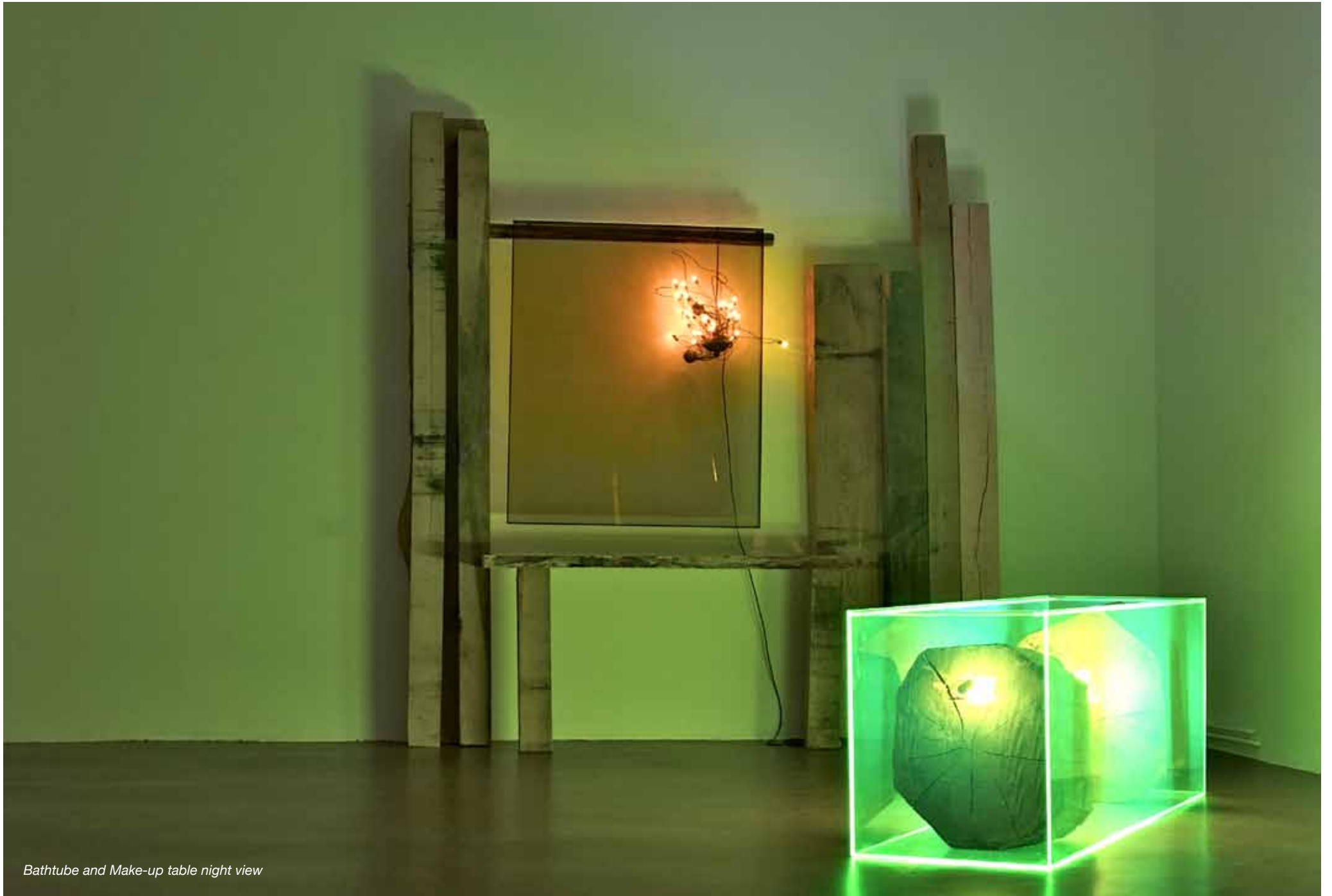
Bathtube and Make-up table night view