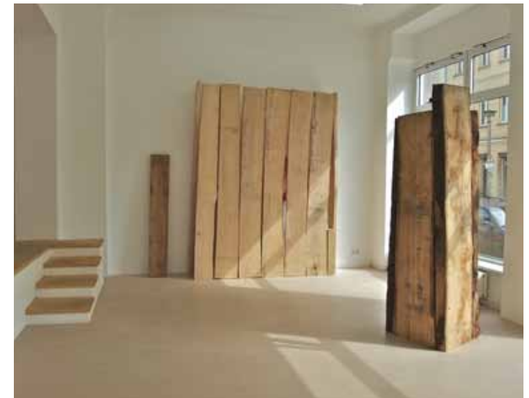
Installation - day view