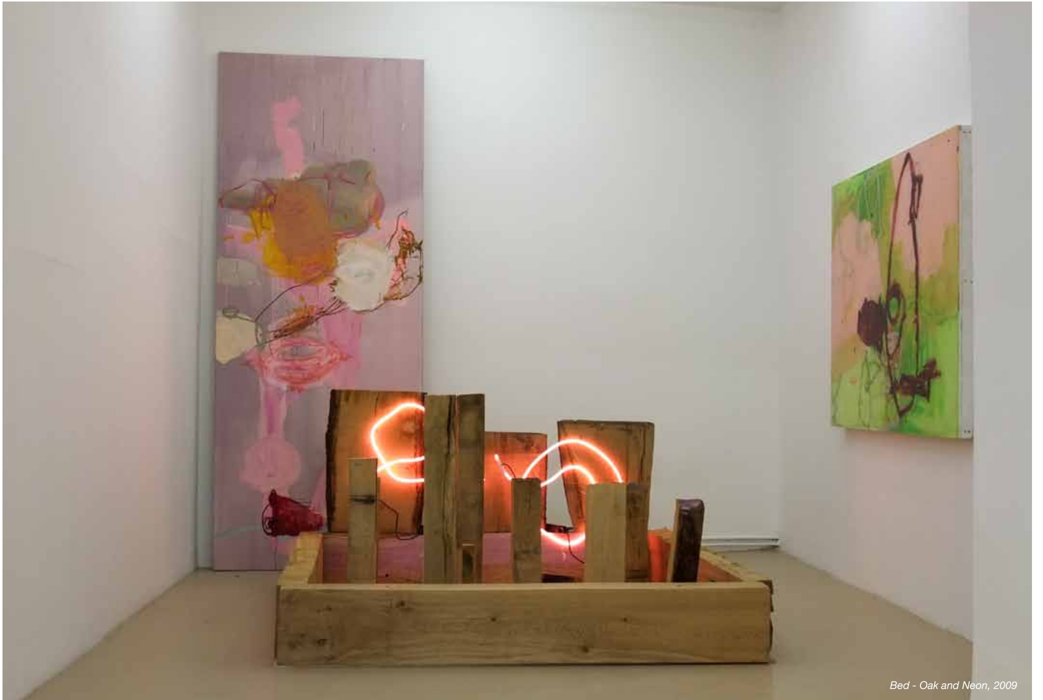
Bed - Oak and Neon, 2009